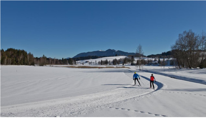
Langlaufloipe Seenrunde