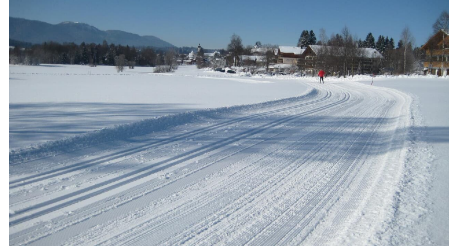
Langlaufloipe Seenrunde - Soier See