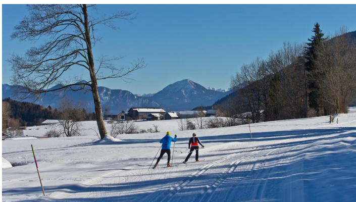
Langlaufloipe - Große Rochusrunde