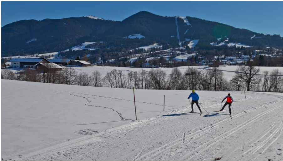
Langlaufloipe - Große Rochusrunde