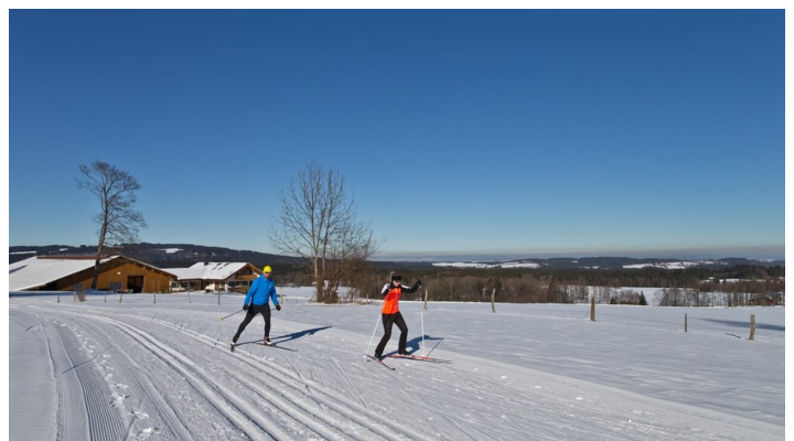
Langlaufloipe - Große Rochusrunde