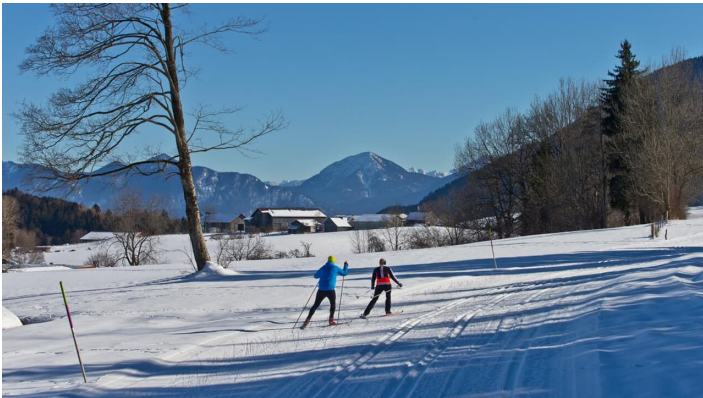
Langlaufloipe - Große Rochusrunde

Prospektmaterial ansehen und/oder bestellen