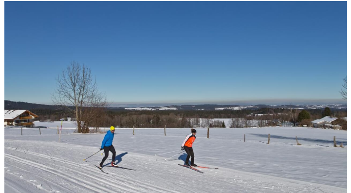
Langlaufloipe Kleine Rochus Runde