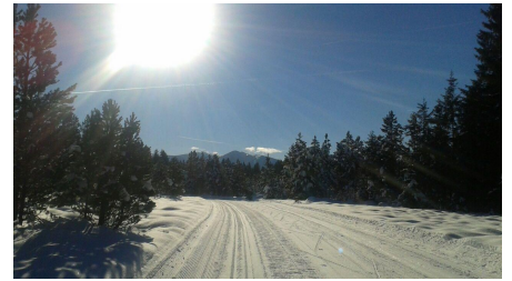
Langlaufloipe Kirmesauer Runde