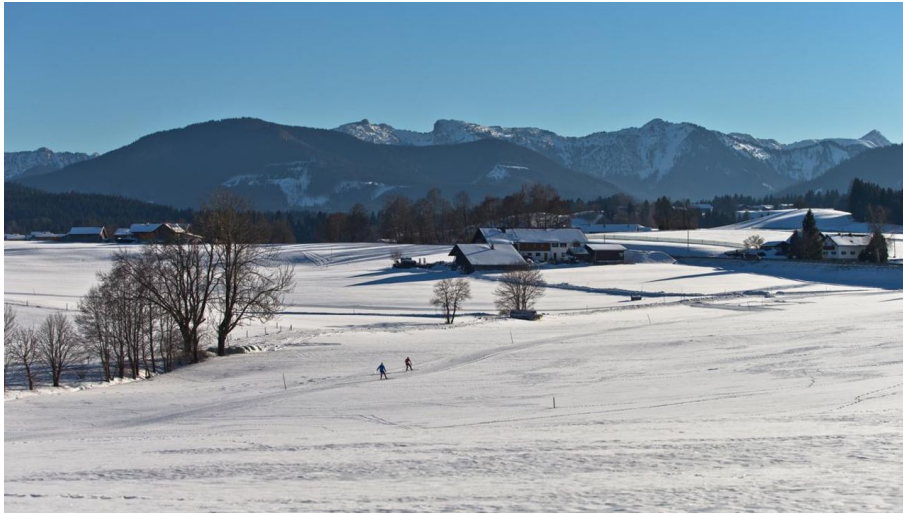
Langlaufloipe Kirmesauer Runde - © Thorsten Unsel, Anton Brey