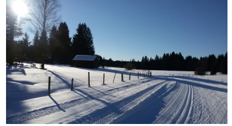
Langlaufloipe Kirmesauer Runde