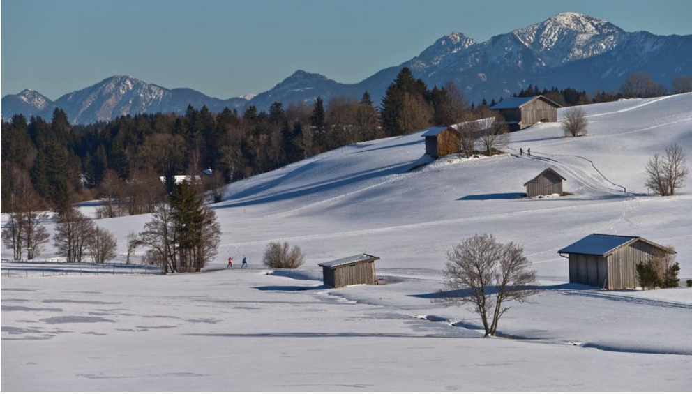
Langlaufloipe Kirmesauer Runde