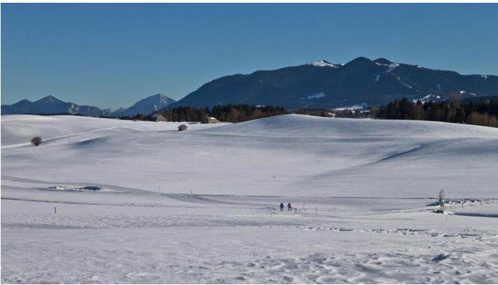
Langlaufloipe Kirmesauer Runde