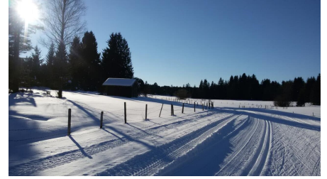
Langlaufloipe Kirmesauer Runde