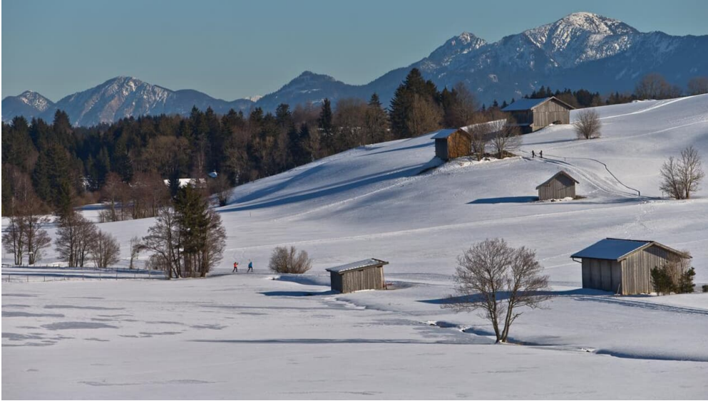
Langlaufloipe Kirmesauer Runde