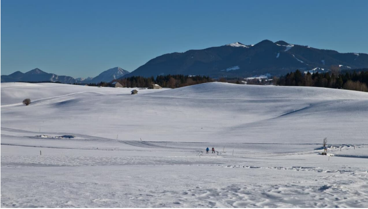
Langlaufloipe Kirmesauer Runde