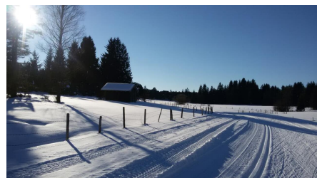
Langlaufloipe Kirmesauer Runde - © Thorsten Unseld, Reiner Frühschütz-Grüning