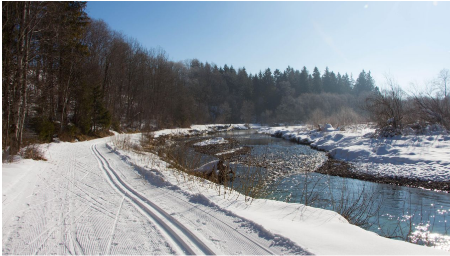
Langlaufloipe Kochelfilz