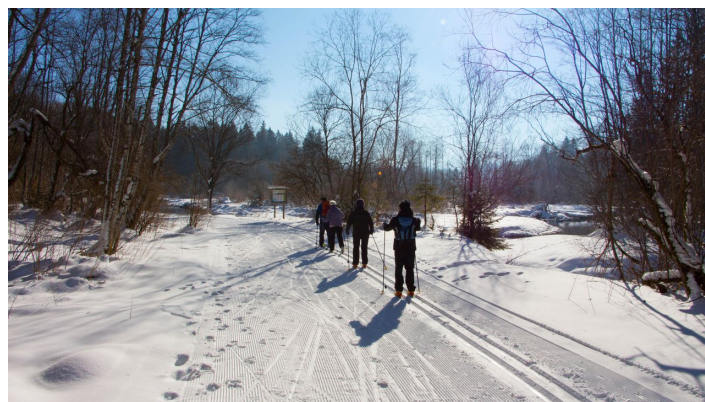
Langlaufloipe Kochelfilz - © Thorsten Unseld, Thorsten Unseld