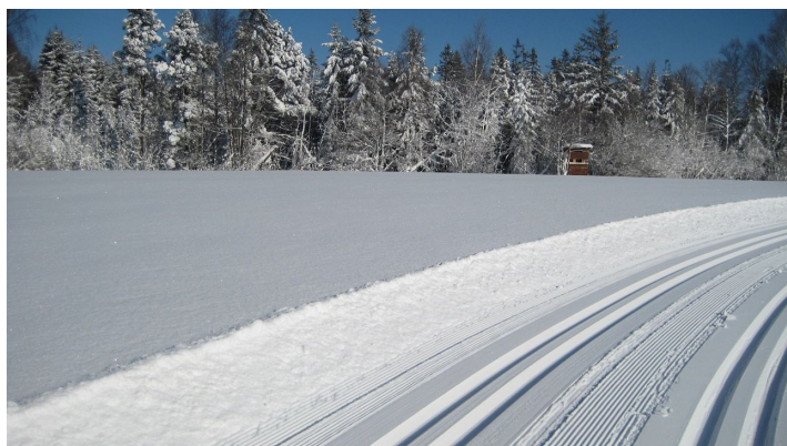
Langlaufloipe Kochelfilz