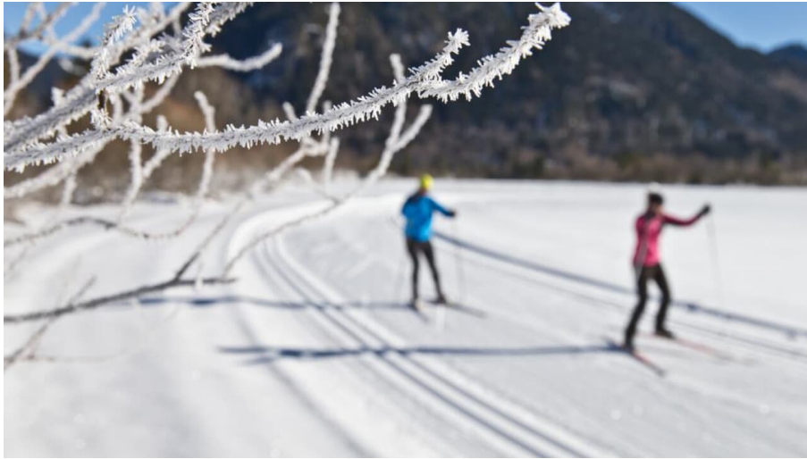
Langlaufen - Scherenauer Runde