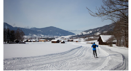
Langlaufloipe - Sonnenrunde