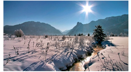
Langlaufloipe Sonnenrunde