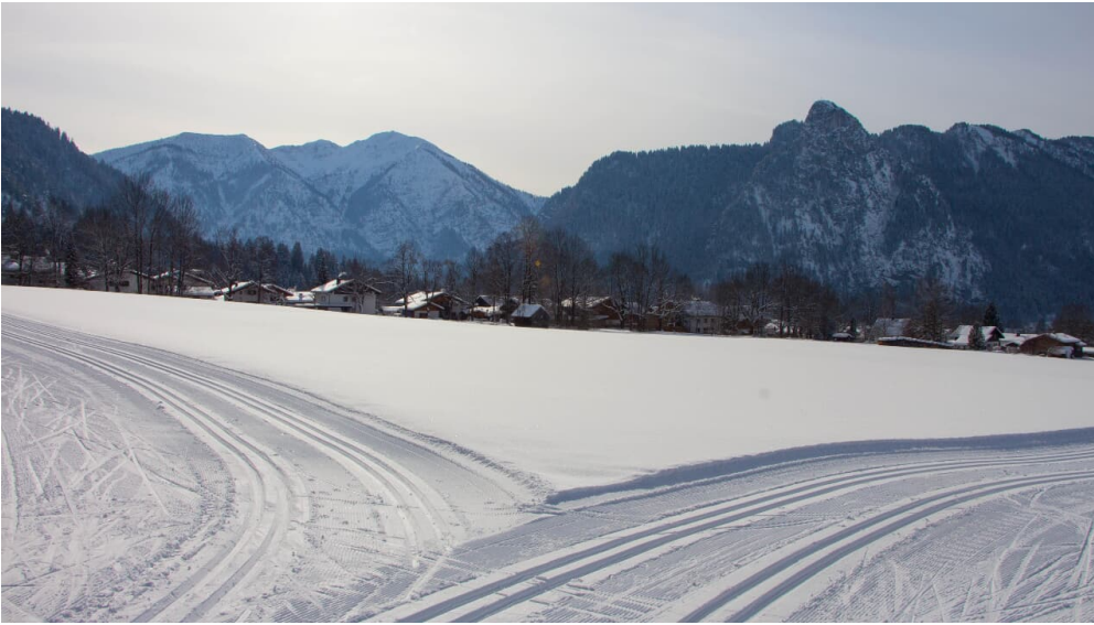
Langlaufloipe - Sonnenrunde