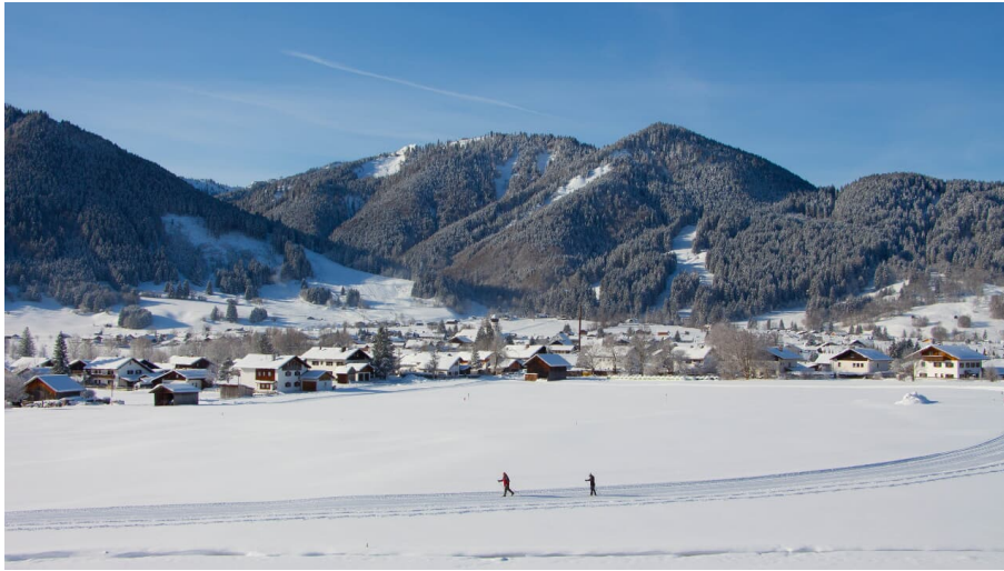
Langlaufloipe - Sonnenrunde