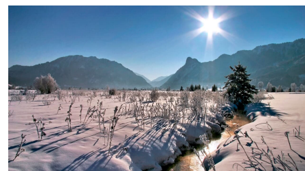
Langlaufloipe Sonnenrunde