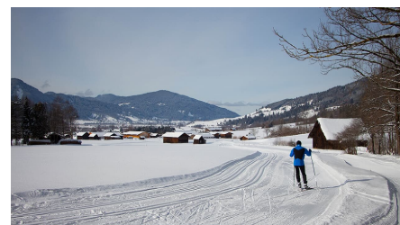
Langlaufloipe - Sonnenrunde