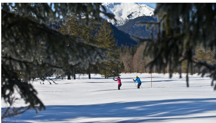
Langlaufloipe Graswangrunde