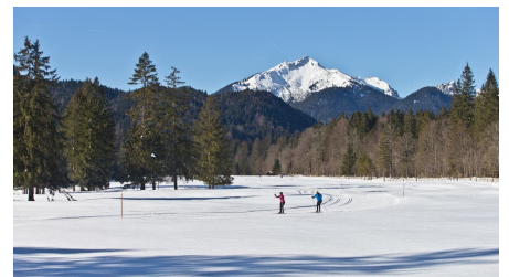
Langlaufloipe Graswangrunde