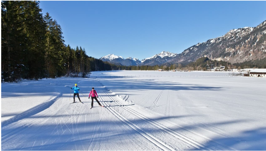
Langlaufloipe Graswangrunde