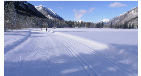
Langlaufloipe Graswangrunde