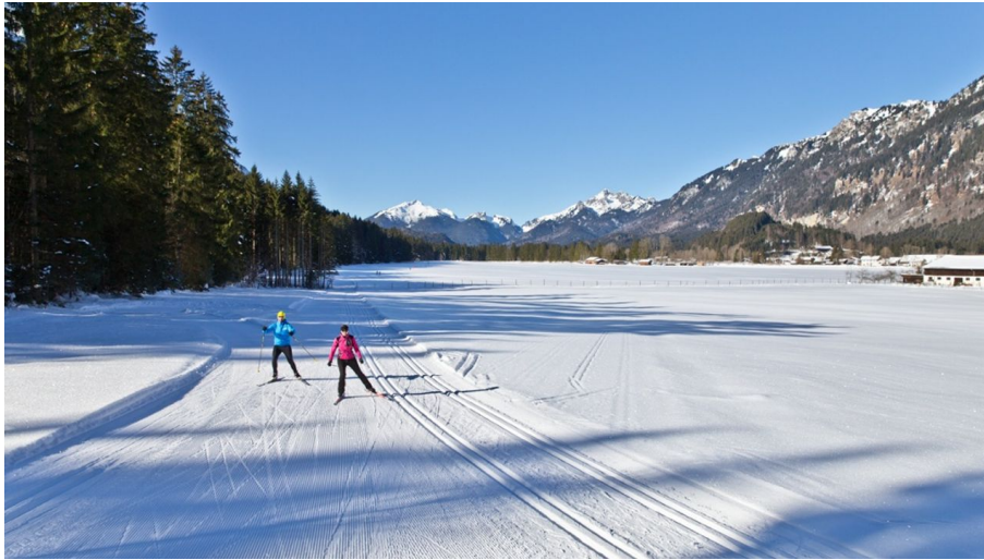
Langlaufloipe Graswangrunde