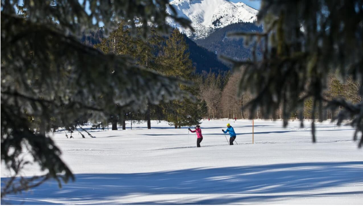
Langlaufloipe Graswangrunde