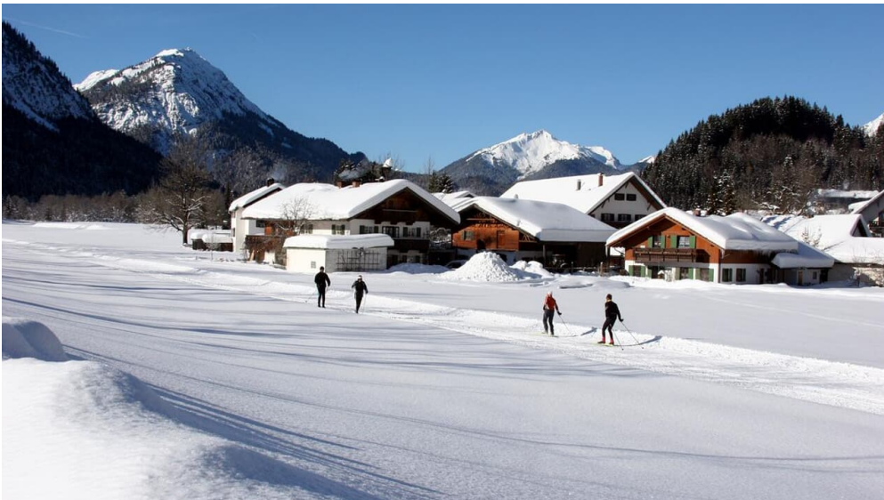
Langlaufloipe Graswangrunde

Prospektmaterial ansehen und/oder bestellen