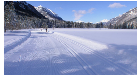
Langlaufloipe Graswangrunde