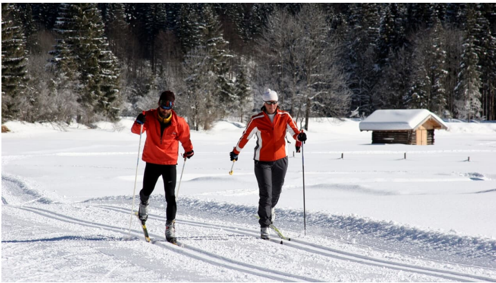
Langlaufloipe Dickelschwaig Runde - Blick auf Gertrudiskapelle und Forsthaus