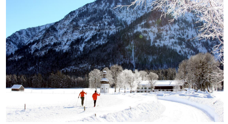
Langlaufloipe Dickelschwaig Runde - Blick auf Gertrudiskapelle und Forsthaus