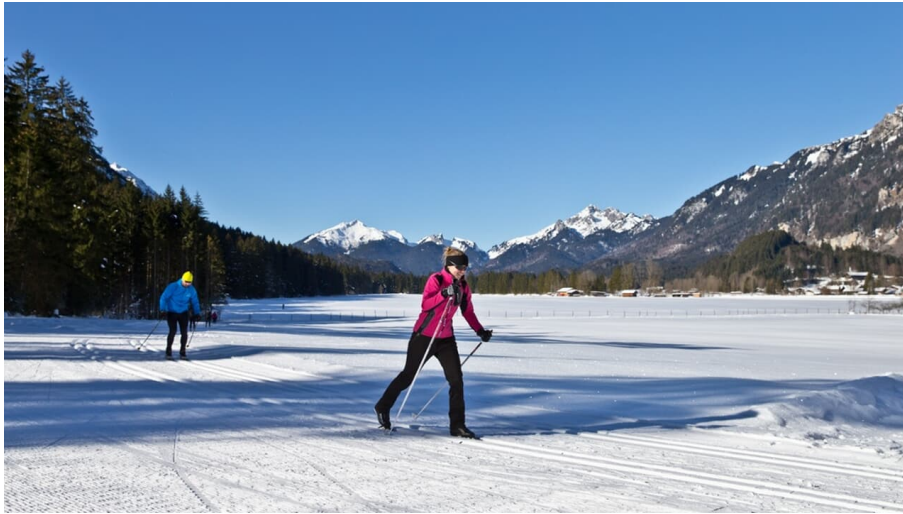
Langlaufloipe Dickelschwaig Runde - Graswangtal mit Scheinberg