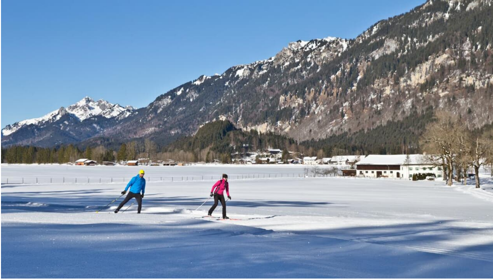
Langlaufloipe Dickelschwaig Runde - am Forsthaus Dickelschwaig