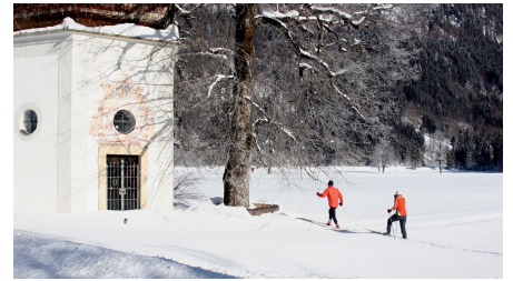
Langlaufloipe Dickelschwaig Runde - Gertrudiskapelle