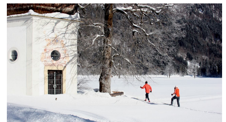
Langlaufloipe Dickelschwaig Runde - Gertrudiskapelle