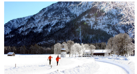
Langlaufloipe Dickelschwaig Runde - Blick auf Gertrudiskapelle und Forsthaus