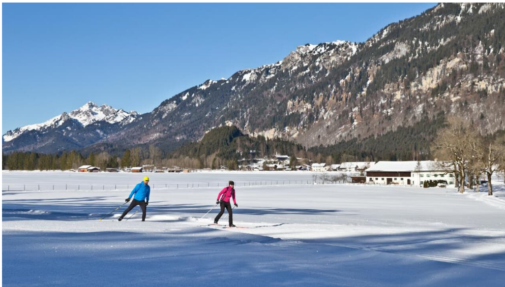
Langlaufloipe Dickelschwaig Runde - am Forsthaus Dickelschwaig

Prospektmaterial ansehen und/oder bestellen