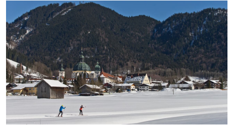
Langlaufloipe Ettaler Runde