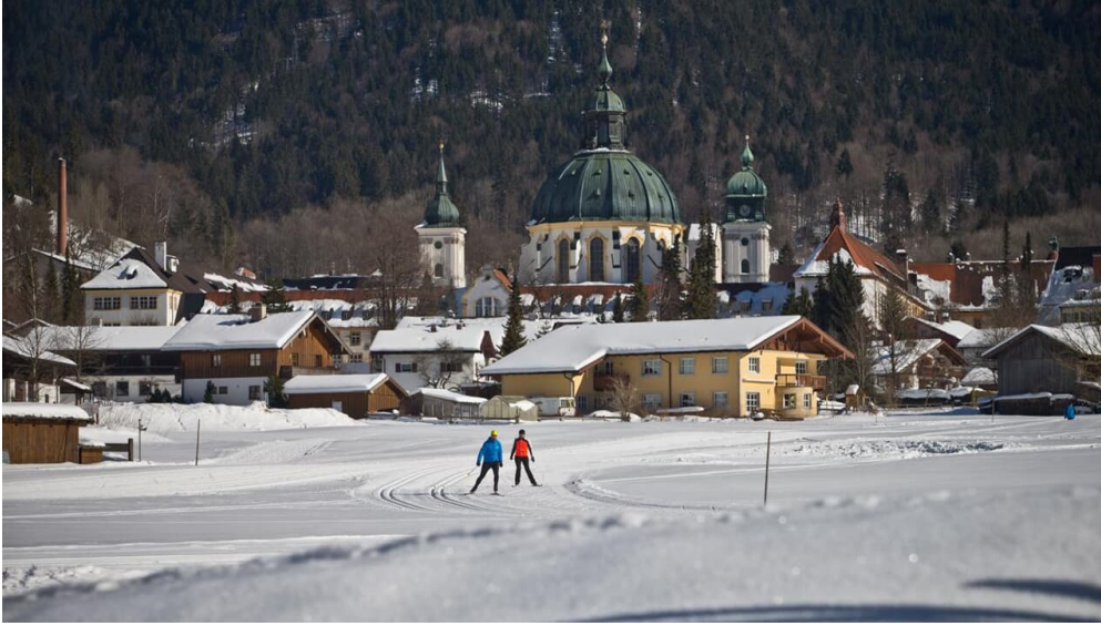
Langlaufloipe Ettaler Runde