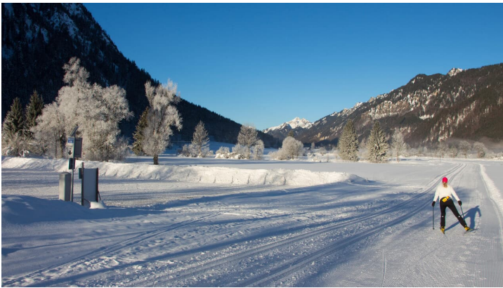
Langlaufloipe Ettaler Runde