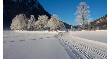
Langlaufloipe Ettaler Runde