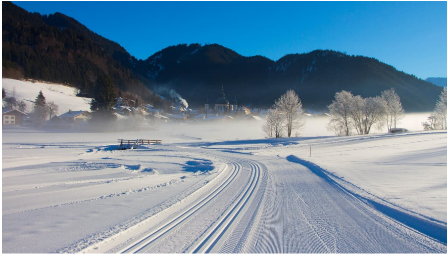
Langlaufloipe Ettaler Runde