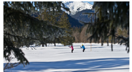
Verbindungsloipe Linderhof Graswang