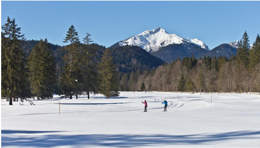
Verbindungsloipe Linderhof Graswang