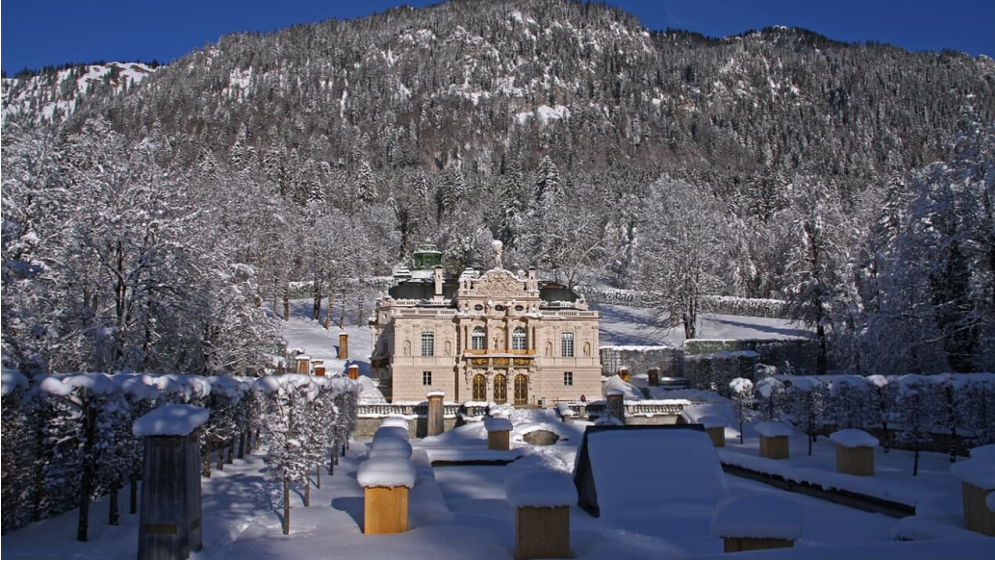
Verbindungsloipe Linderhof Graswang - Schloss Linderhof