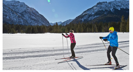
Verbindungsloipe Linderhof Graswang