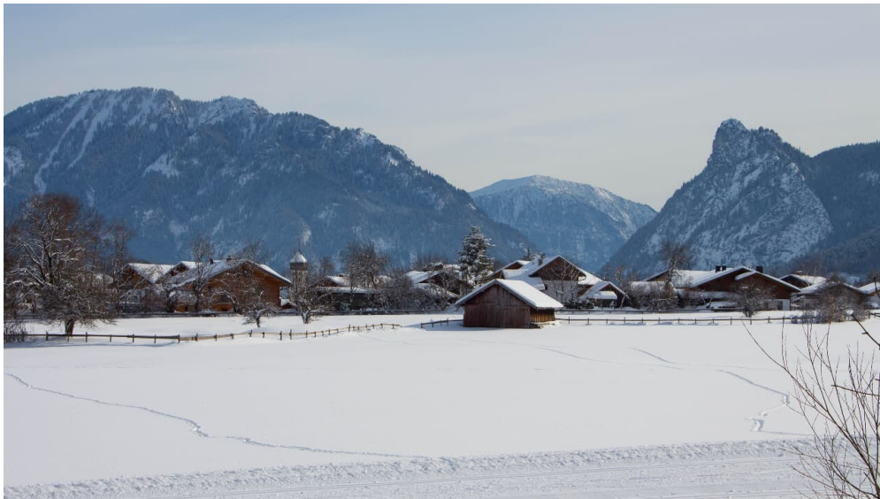
Verbindungsloipe Unterammergau Oberammergau