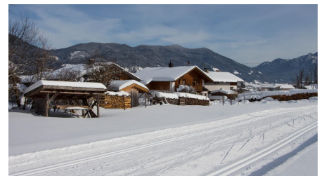
Verbindungsloipe Unterammergau Oberammergau