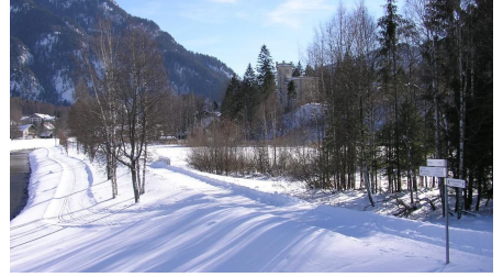
Verbindungsloipe Unterammergau Oberammergau