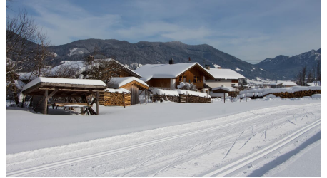
Verbindungsloipe Unterammergau Oberammergau