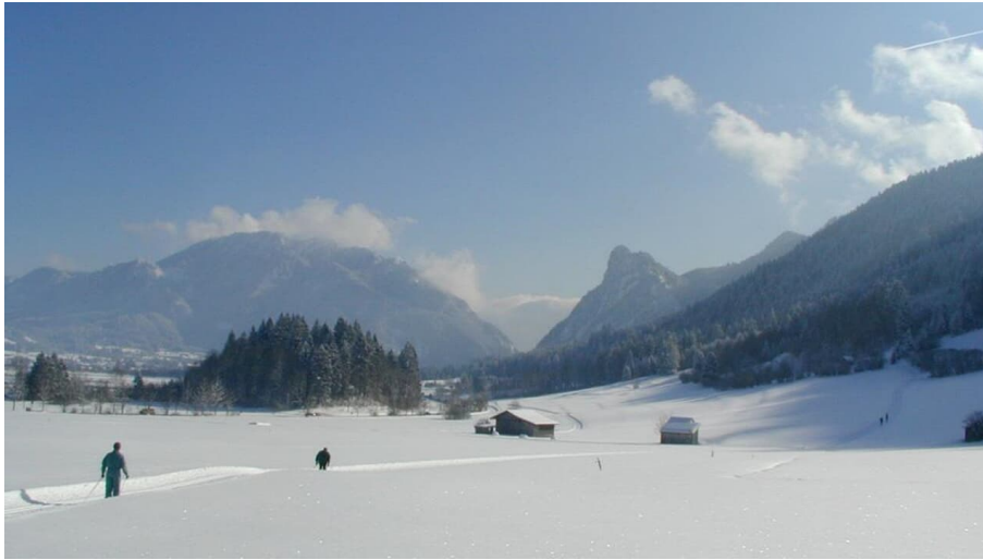
Verbindungsloipe Unterammergau Oberammergau - © Thorsten Unsel, Naturpark Ammergauer Alpen