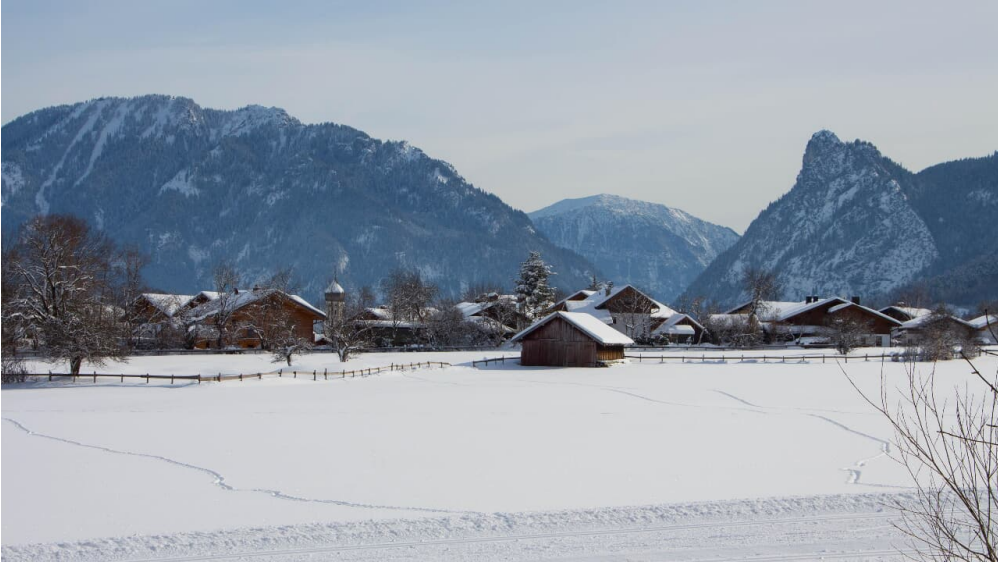
Verbindungsloipe Unterammergau Oberammergau