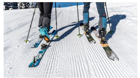
Pistenskitour Naturpark Ammergauer Alpen