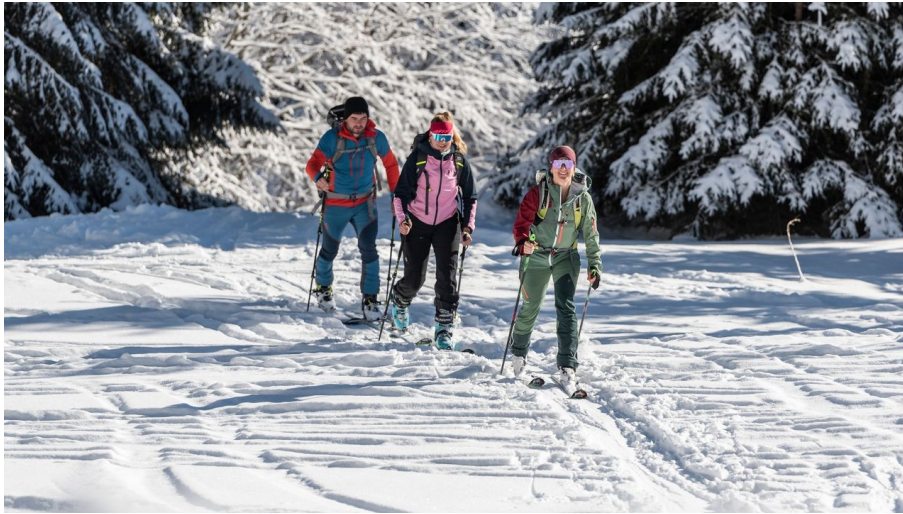
Skitour Naturpark - © Simon Bauer, Naturpark Ammergauer Alpen