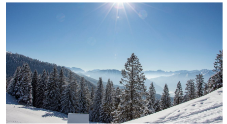
Hörnle im Februar