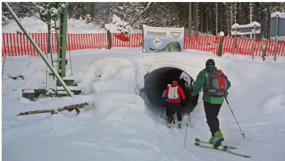
Skitour Kolbensattel