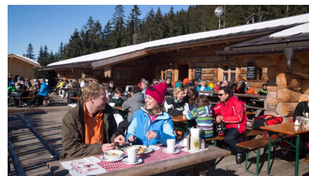
Skitour Kolbensattel - © Thorsten Unseld, Best of Winter CC Thomas Bichler