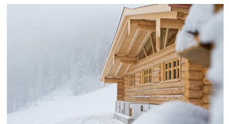
Skitour Kolbensattel - © Thorsten Unseld, AktivArena am Kolben CC Matthias Fend