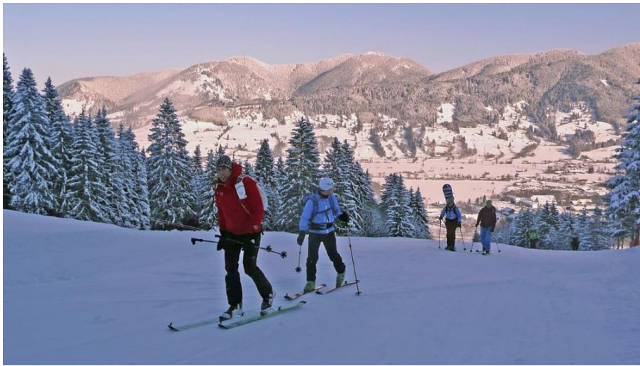
Skitour Kolbensattel