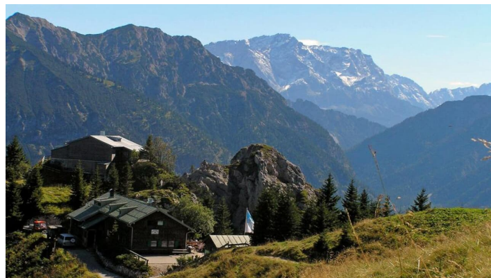
Mountainbiketour - Pürschling