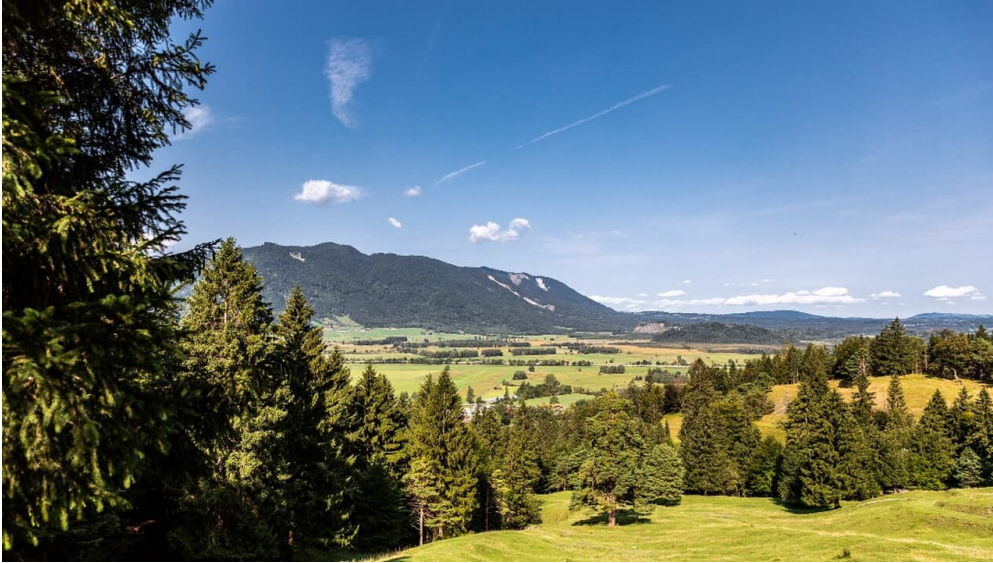
Kurz vor Eschenlohe