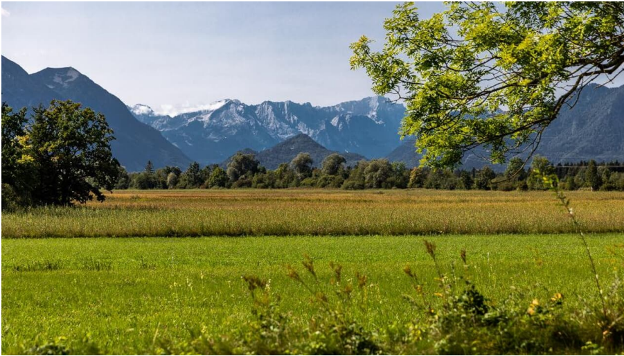
Blick über Moor auf Zugspitzmassiv