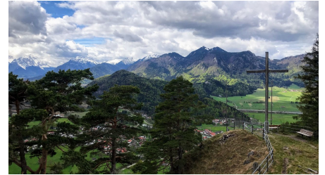
Das Heldenkreuz oberhalb von Ohlstadt