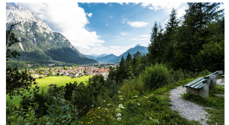
Der Blick über Mittenwald kurz vor unserem Etappenende