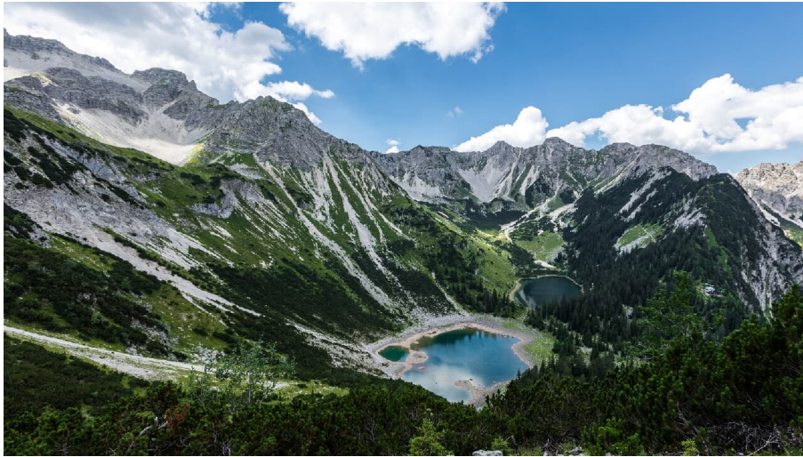
Bergseen (Soiernseen) von oben