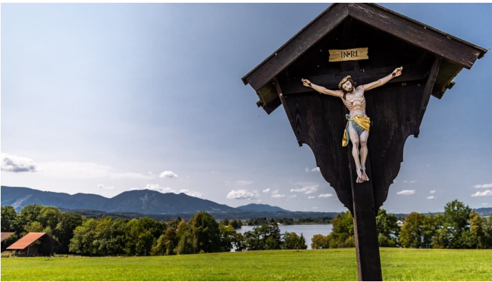
Aussichtspunkt kurz vor Seehausen