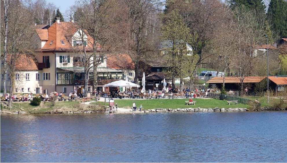
Seerestaurant Alpenblick