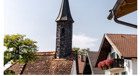
Kapelle von Vorderkehr