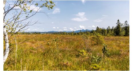
Im Moor nahe des Staffelsees