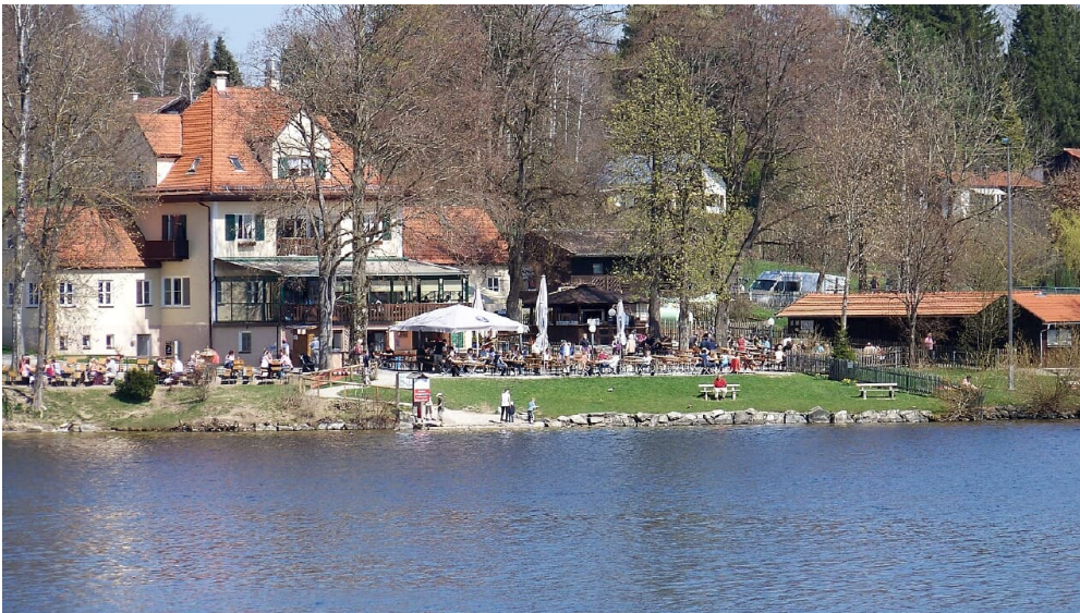
Seerestaurant Alpenblick

Mehr Informationen zur Region Blaues Land und zum Staffelsee