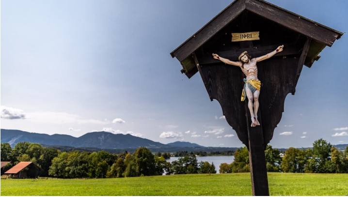
Aussichtspunkt kurz vor Seehausen