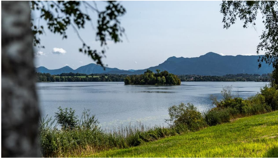
Staffelsee mit Insel