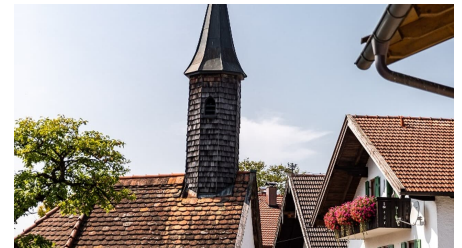
Kapelle von Vorderkehr