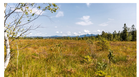
Im Moor nahe des Staffelsees