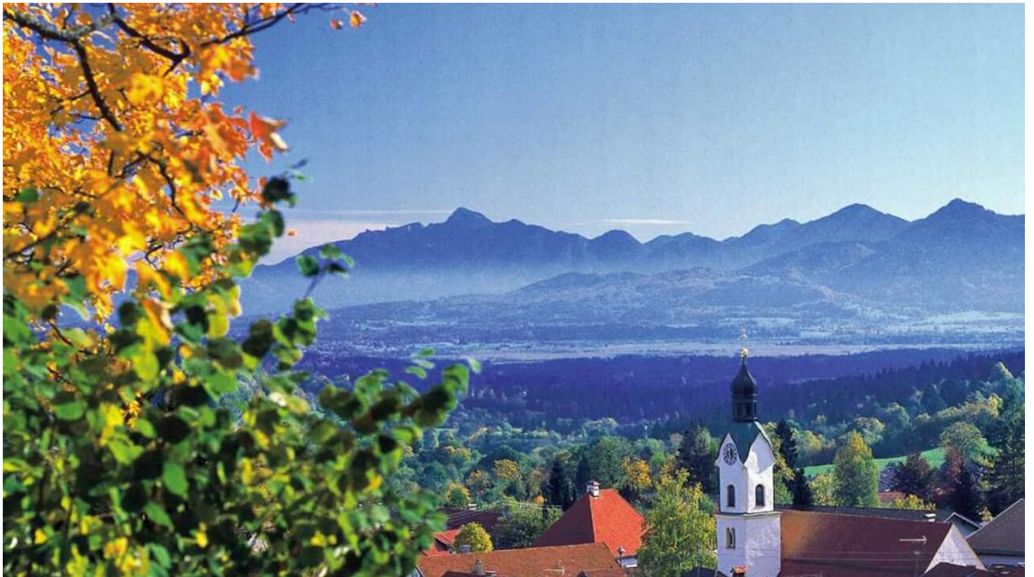
Radtour Geizenmoostour - Blick auf Kohlgrub - © Thorsten Unseld, Gemeinde Bad Kohlgrub