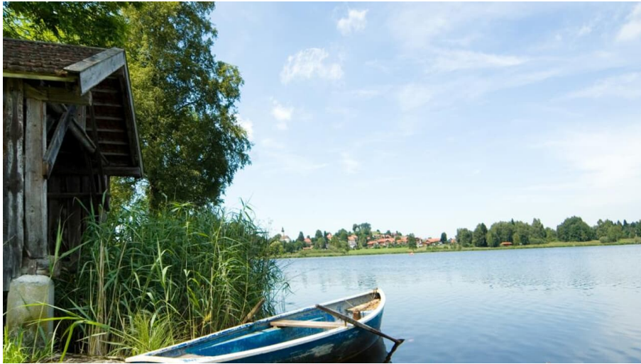
Radtour Geizenmoostour - Soier See