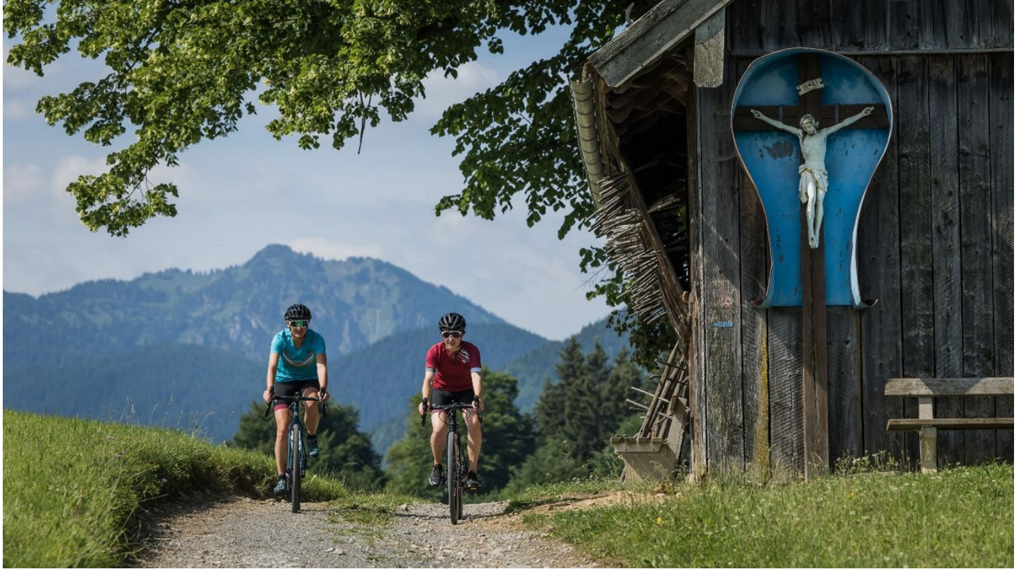
Gravelbiken im Naturpark