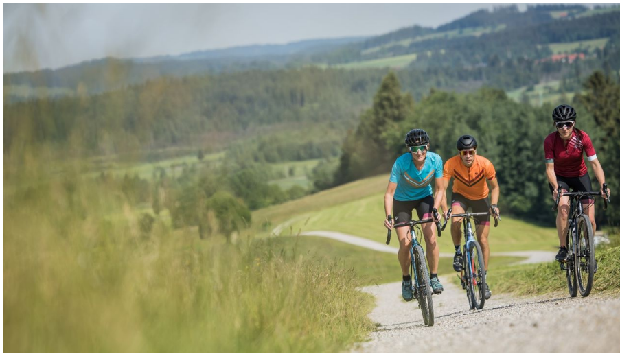
Gravelbiken Naturpark