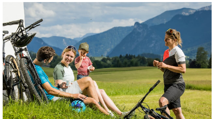
Blick Ammertal