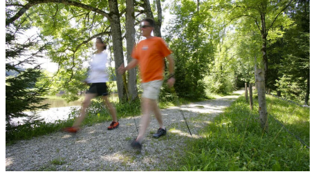
Nordic Walking Rantscher-Weiher-Trail