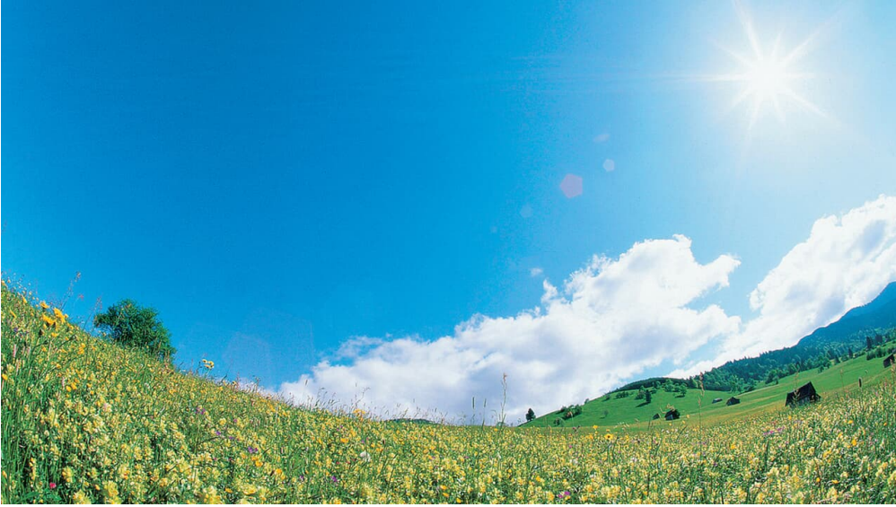
Nordic Walking Rantscher-Weiher-Trail - Blumenwiese bei Bad Bayersoien