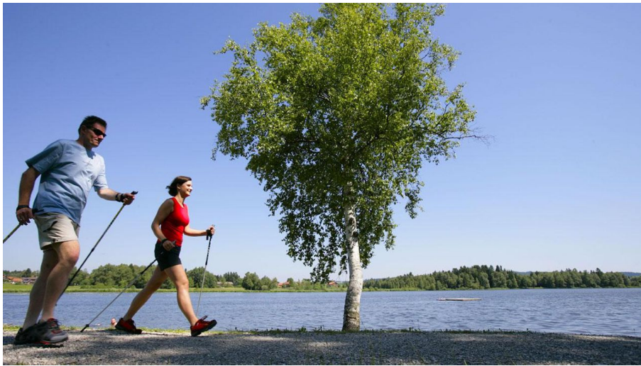
Nordic Walking Geizenmoos-Trail - am Soier See