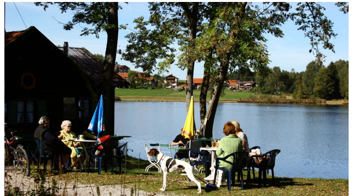
Nordic Walking Geizenmoos-Trail - Rast am Fischhäusl am Soier See