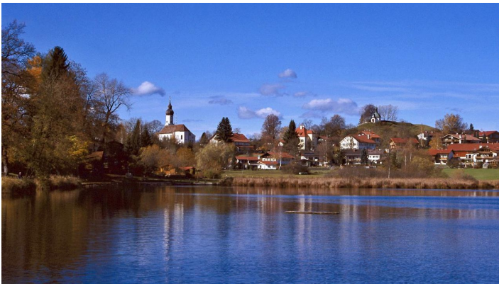
Nordic Walking Geizenmoos-Trail - am Soier See