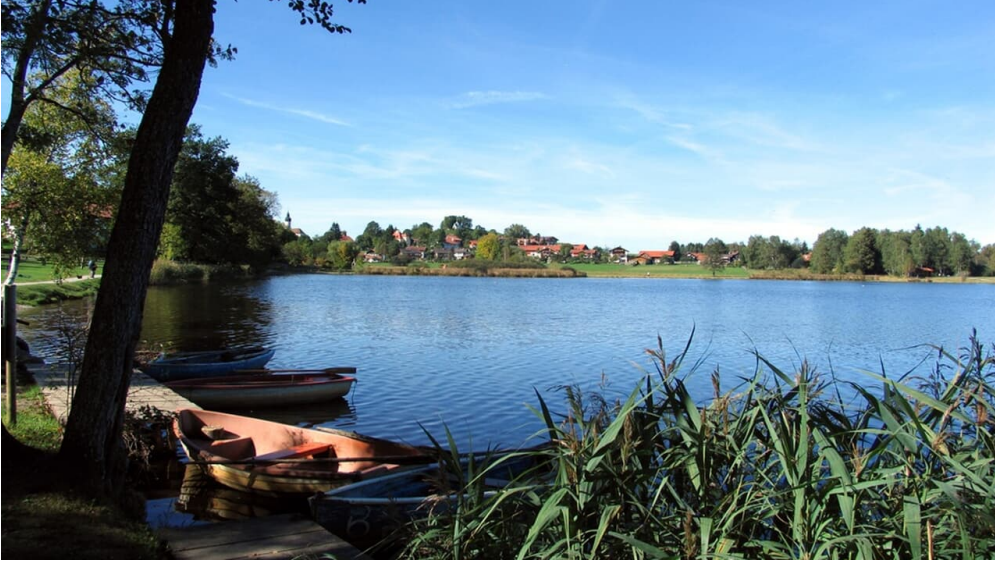
Nordic Walking Soier See Trail