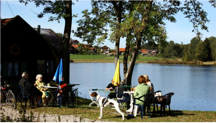
Nordic Walking - Soier-See-Trail