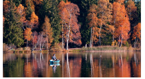
Nordic Walking - Soier-See-Trail