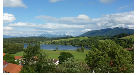
Nordic Walking Soier See Trail