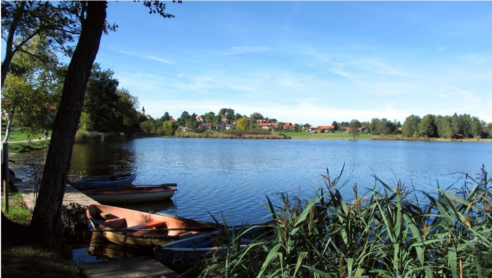
Nordic Walking Soier See Trail

Prospektmaterial ansehen und/oder bestellen