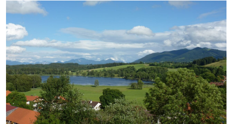
Nordic Walking Soier See Trail