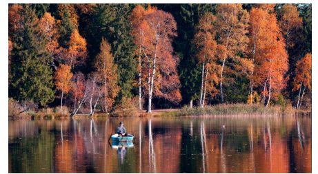
Nordic Walking - Soier-See-Trail - © Thorsten Unsel, Ammergauer Alpen GmbH