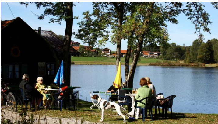
Nordic Walking - Soier-See-Trail