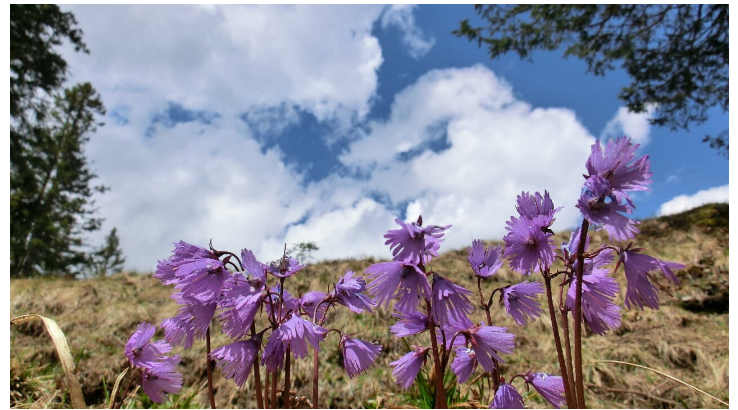
Auf der Hohen Bleick