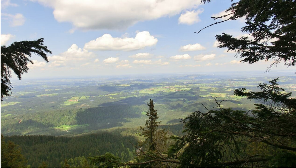
Blick ins Alpenvorland zur Wieskirche