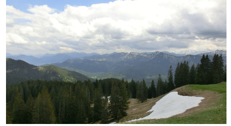
Gipfel Niederbleick