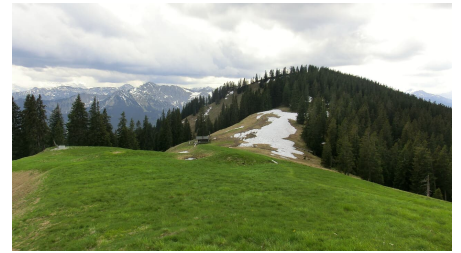
Gipfel Niederbleick, Bleick Hütte