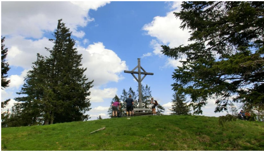
Gipfel Hohe Bleick