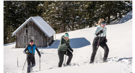
Schneeschuhwandern am Hörnle