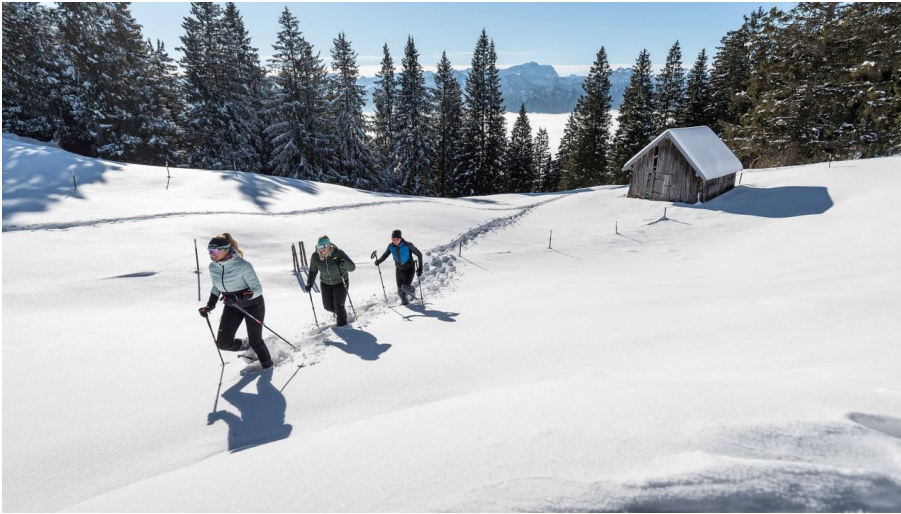
Schneeschuhwanderung Hörnle