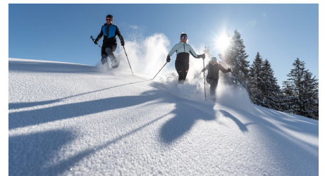
Spaß im Schnee Hörnle