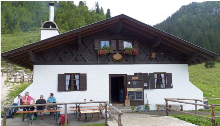
Wettersteinalm 3642