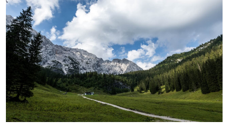
Die urige Wettersteinalm