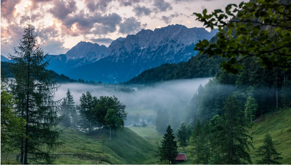
Der Ferchensee im Morgengrauen