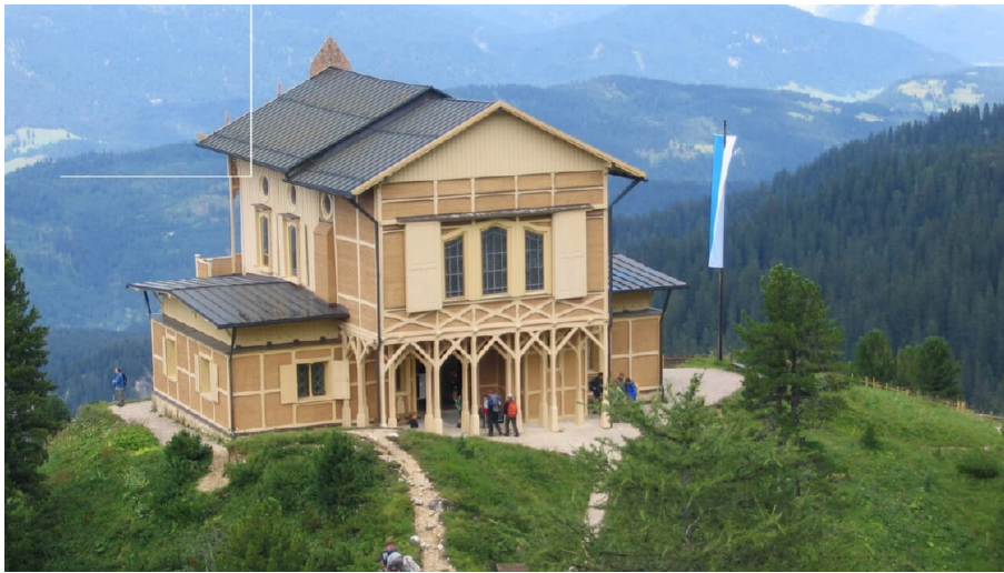
Jagdschloss Schachen