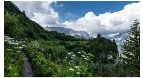
Oberes Reintal mit Pflanzenvielfalt