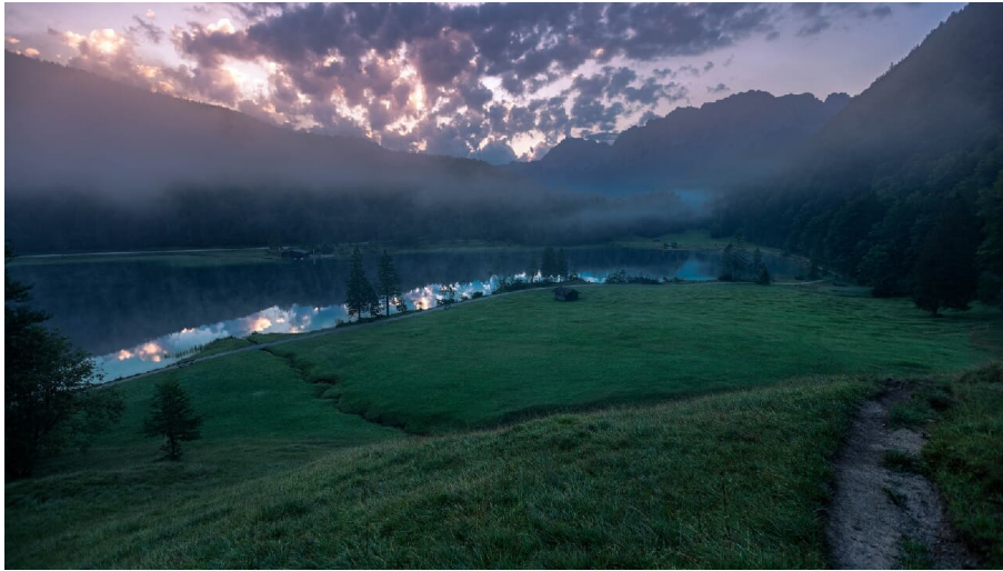
Der Ferchensee bei Mittenwald