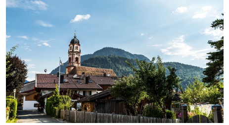
Wir starten im Geigenbauort Mittenwald