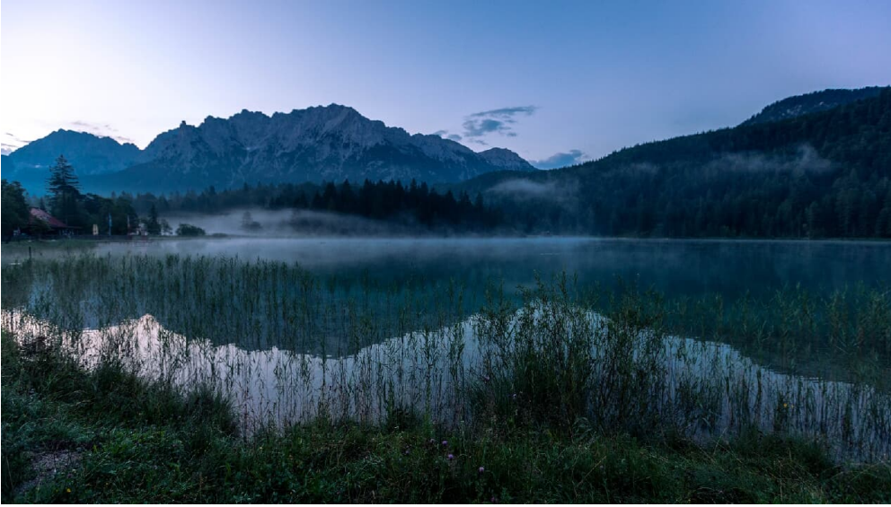
Lautersee am frühen Morgen mit Nebelschwaden