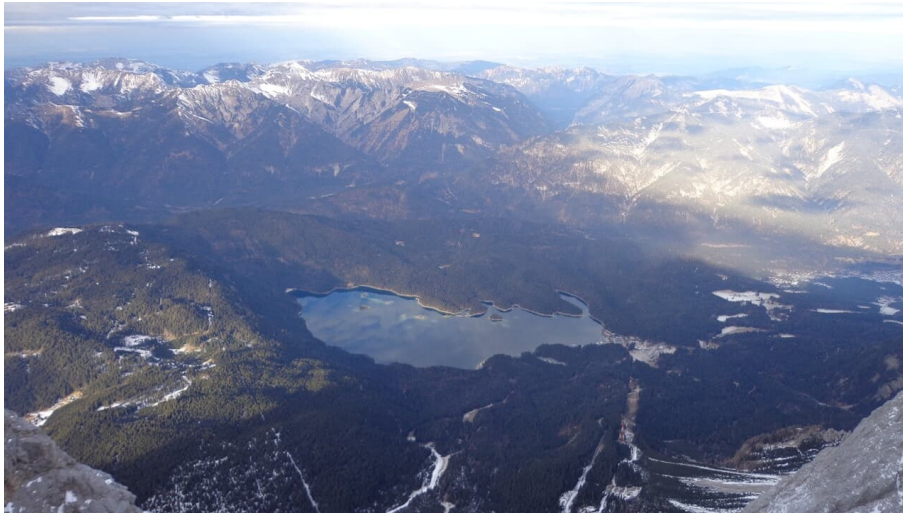
Gipfelblick von der Zugspitze auf den Eibsee