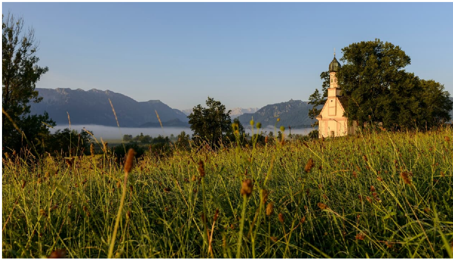
Murnauer Moos