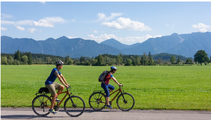
Radfahren am Murnauer Moos