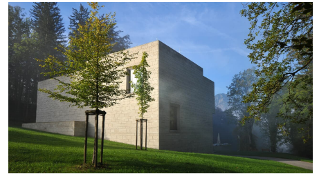
Franz Marc Museum in Kochel am See