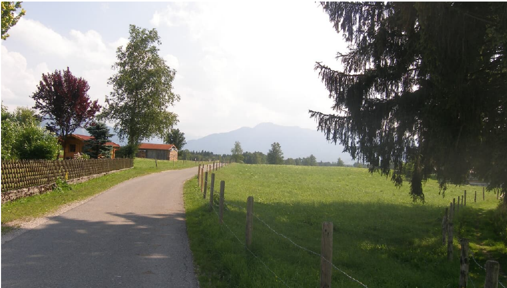
Am Ortsausgang Sindelsdorf blicken wir auf das Alpenpanorama.