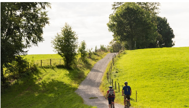
Radfahren durch saftige Wiesen in der Zugspitz Region