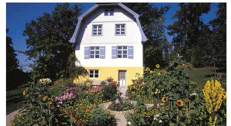
Münterhaus im Sommer