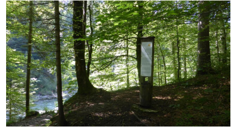
Stele Meditationsweg - Scheibum