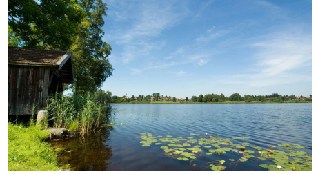
Soier See in Bad Bayersoien