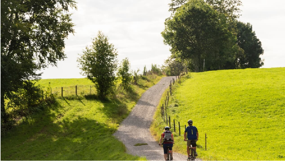
Radfahren durch saftige Wiesen in der Zugspitz Region