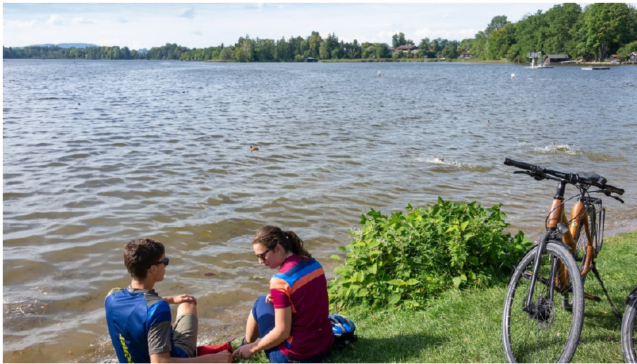
Der merlische Staffelsee