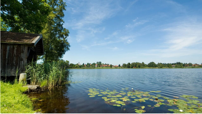
Soier See in Bad Bayersoien