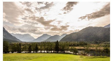
Die Sieben Quellen