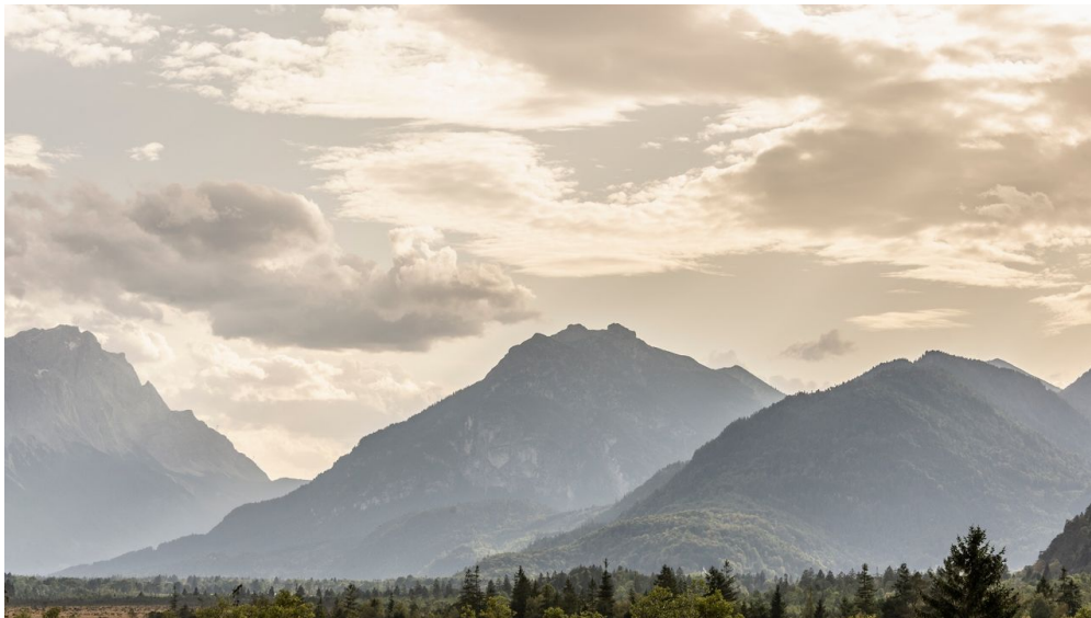
Der Ausblick gen Berge auf dem Weg von Murnau nach Garmisch-Partenkirchen