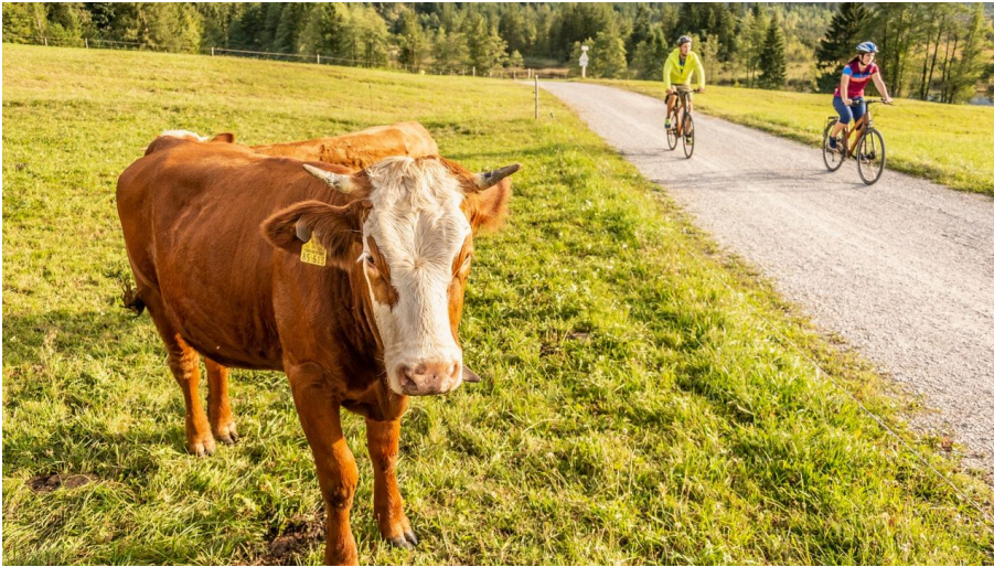
Die gut ausgebauten Radwege im Loisachtal