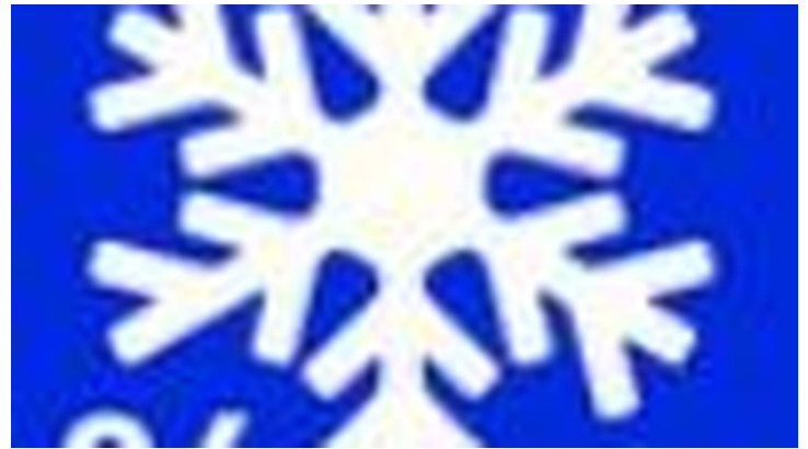
Winterwanderweg 4 Altherrenweg