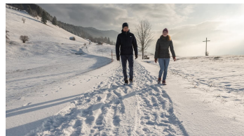
Winterwandern Altherrenweg