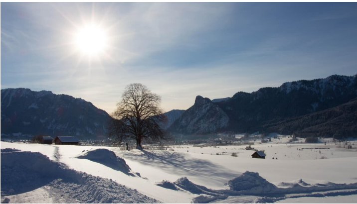
Winterwanderung - Altherrenweg - © Thorsten Unseld, Thorsten Unseld