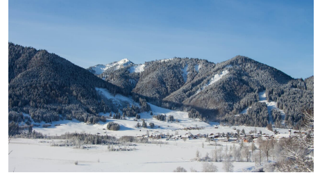
Winterwanderung - Altherrenweg