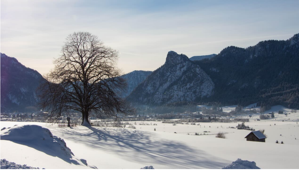
Winterwanderung - Altherrenweg