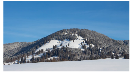
Winterwanderung - Altherrenweg