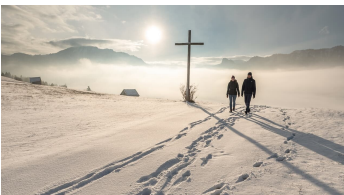
Winterwandern Altherrenweg