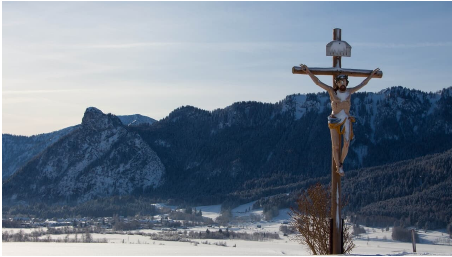
Winterwanderung - Altherrenweg