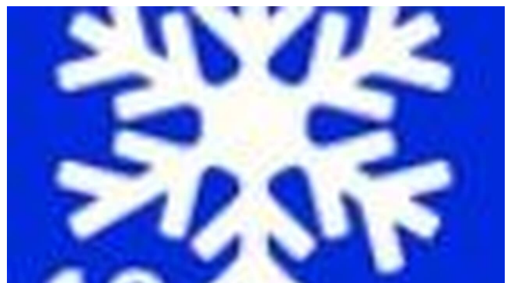
Winterwanderweg 12 Rantscher Weiher