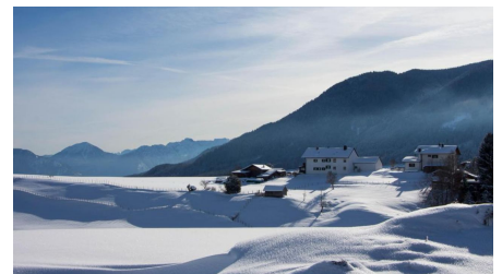
Winterwanderung - Rantscher Weiher