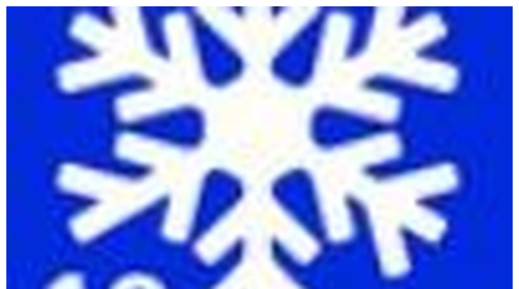
Winterwanderweg 12 Rantscher Weiher