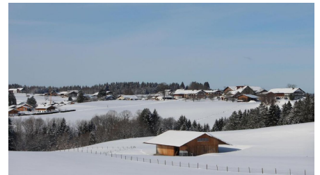
Winterwanderung - Rantscher Weiher - © Thorsten Unsel, Naturpark Ammergauer Alpen