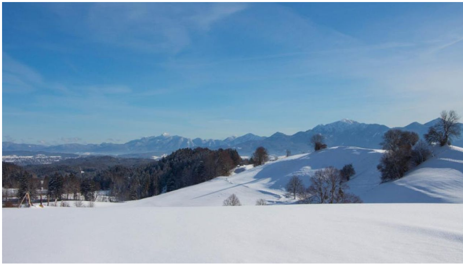
Winterwanderung - Rantscher Weiher