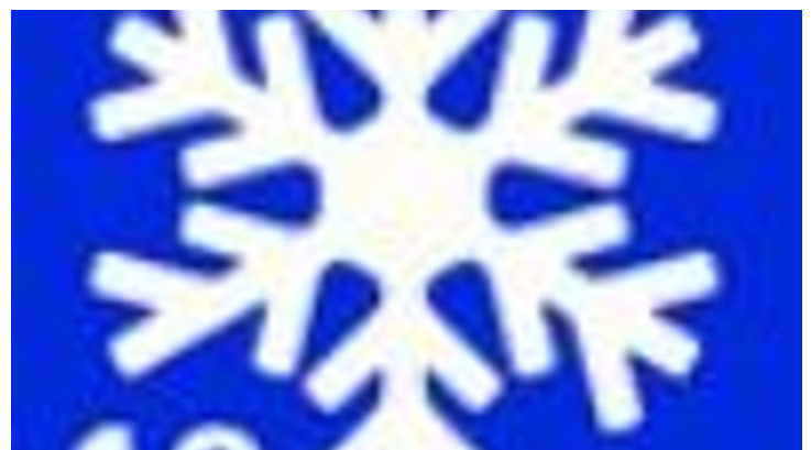
Winterwanderweg 12 Rantscher Weiher