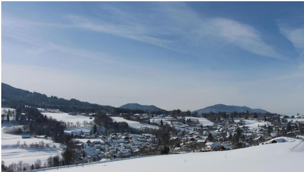
Winterwanderung - Rantscher Weiher - © Thorsten Unsel, Naturpark Ammergauer Alpen