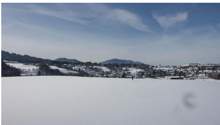
Winterwanderung - Rantscher Weiher - © Thorsten Unsel, Naturpark Ammergauer Alpen